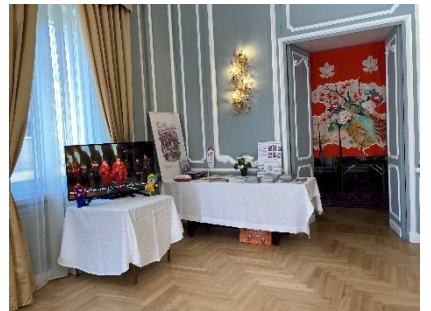
(3月4日) 在バチカン日本国大使公邸におけ