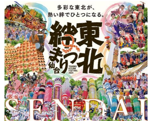
東北絆まつり実行委員会