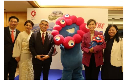
(2月27日) 左から デリック・ゴー議員、石川裕子大使夫人、石川浩司駐シンガポール日本大使、ジョセフィン・テオ情報通信大臣兼第二内務大臣、ヨー・ワンリン議員