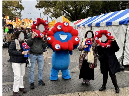
ミyakumiyakuグリーティングの様子