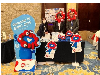
提供：在重慶日本国総領事館 (2月21日)