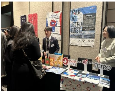
提供：在韓国日本国大使館 (天皇誕生日祝賀レセプション 開催日：2月19日。以下同) JETRO ソウル事務所による提