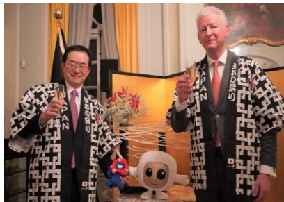
(2月27日) ベルギー万博マスコットのベルベルとミャクミャクとともに記念撮影 (左から三上大使と Pieter DE CREM ベルギー万博事務総長)