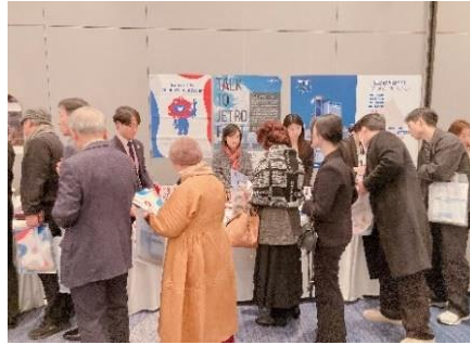
(2月20日) 在釜山日本国総領事館主催レ セプションにおける広報の様子