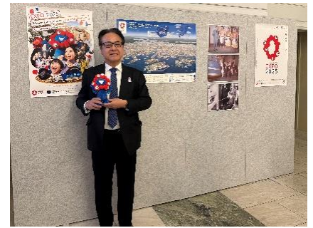
(2月20日) 水越英明駐スウェーデン日本大使