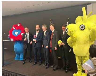
提供: 在チェコ日本国大使館(2 月24日) 左から 長岡駐チェコ日本大使 ラースカ上院議員、ヴィストルチ