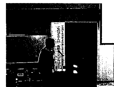
企画提案書の発表